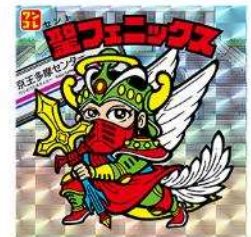
京王多摩センター駅